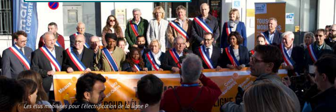
Les élus mobilisés pour l'électrification de la ligne P