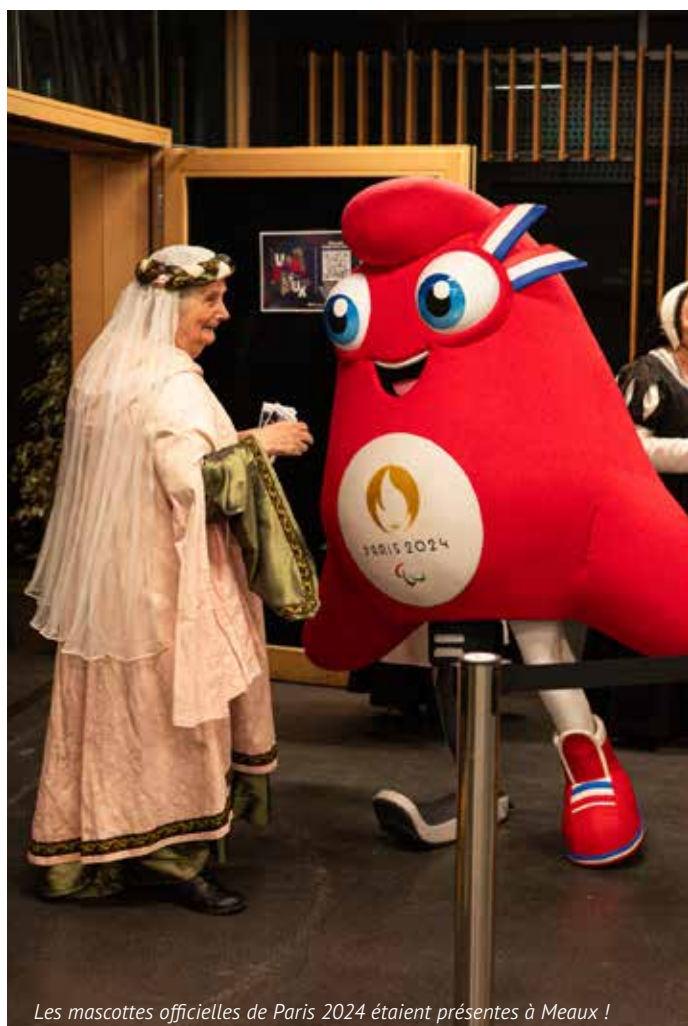
Les mascottes officielles de Paris 2024 étaient présentes à Meaux !

Sécurité, santé, attractivité des commerces, concrétisation de nos GRANDS PROJETS (Cinéma UGC Le Majestic, Cité de la Musique Simone Veil, restauration de la Cité Épiscopale, de la Tour Noire, Tranchée pédagogique du Musée de la Grande Guerre, démolition des tours Camargue et Chambord), préservation de l'environnement, proximité et enfin le développement d'un territoire d'industrie et de projets, avec le retour des Rencontres Roissy Meaux Aéroport.