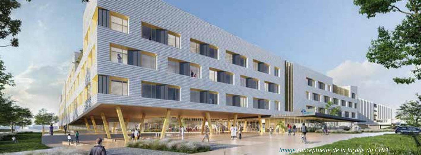
Image conceptuelle de la façade du GHEF