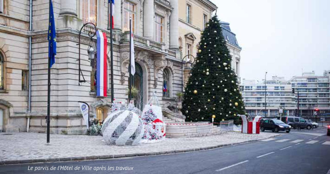
Le parvis de l'Hôtel de Ville après les travaux