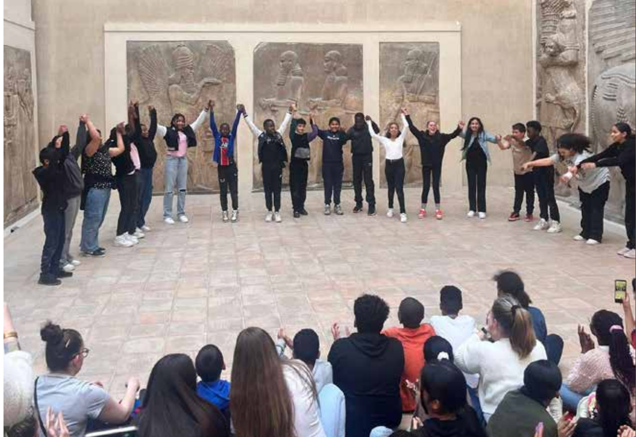
Trois classes des Collèges de la Cité Éducative ont bénéficié d'une immersion forte au sein des collections du Louvre