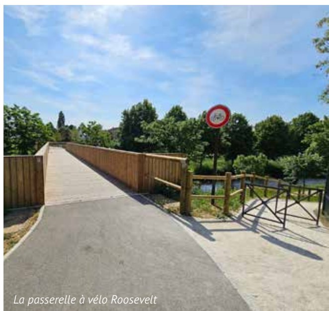
La passerelle à vélo Roosevelt

Des routes départementales au réseau ferroviaire en passant par les mobilités douces, le Département est déterminé à faire de la mobilité des Meldois une priorité.