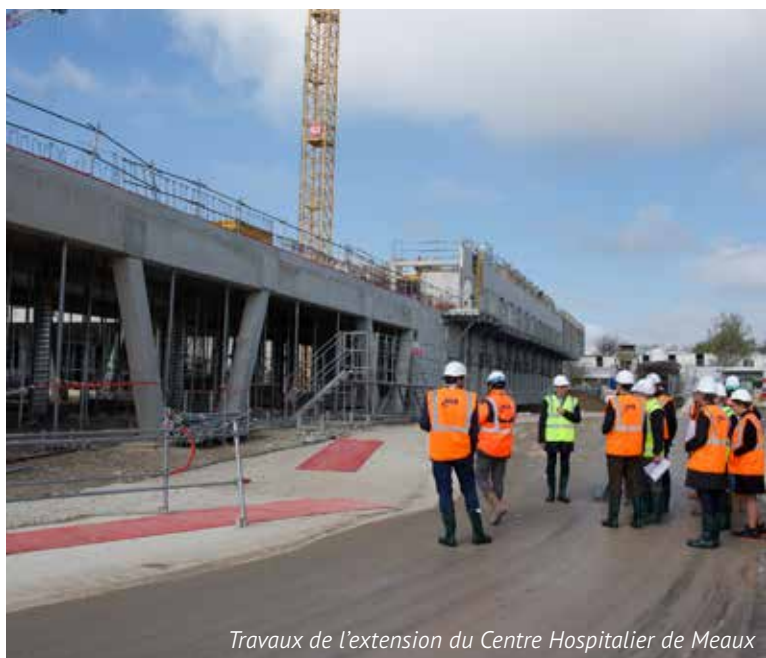
Travaux de l'extension du Centre Hospitalier de Meaux

Nous œuvrons pour un système de santé qui ne se limite pas à répondre aux besoins actuels, mais qui anticipe et prévient les problèmes futurs, garantissant ainsi le bien-être des habitants et des soignants.