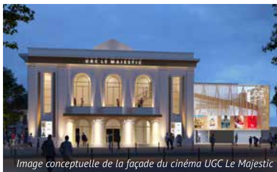
Image conceptuelle de la façade du cinéma UGC Le Majestic

Comme vous le savez tous, la date d'inauguration officielle a été dévoilée lors de la cérémonie des vœux par Jean-François Copé.