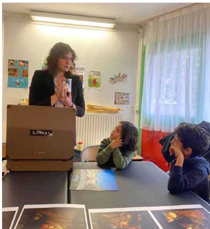
Médiation « Malette sensorielle Les Saisons »

Pour toutes informations complémentaires, nous vous invitons à vous rapprocher de la Direction de l'action culturelle ( ActionCulturelle@meaux.fr ) ou des établissements concernés.