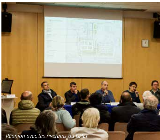
Réunion avec les riverains du GHEF

Les consultations sont assurées par des médecins généralistes, sept jours sur sept, de 20h à minuit.