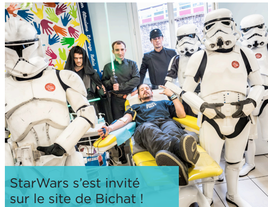
StarWars s'est invité sur le site de Bichat !

Les personnages de la célèbre saga StarWars membres des associations Rebel legion et 501st Legion Garrison ont investi l'Hôpital Bichat le samedi 2 juillet. L'objectif était de rencontrer les fans et de promouvoir le don de sang. Bilan positif pour le personnel et les donneurs. De plus, le site a accueilli plus de donneurs en comparaison aux samedis habituels. C'est avec grand plaisir que l'équipe souhaite renouveler l'action l'année prochaine.