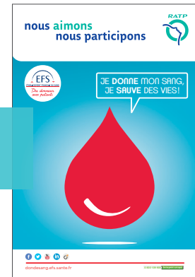
Campagne affiche été RATP

L'Etablissement français du sang Ile-de-France avec le soutien de la RATP, partenaire fidèle, a mis en place durant l'été 2016 une campagne d'affichage du 13 juillet au 3 août pour sensibiliser les usagers à l'importance de donner son sang pendant les vacances, période traditionnellement sensible. « Je donne mon sang, je sauve des vies ! » slogan de cette opération de sensibilisation était visible dans les stations de métro et RER parisiens sur plus de 600 affiches.