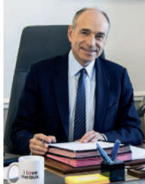
Jean-François Copé Ancien ministre, Maire de Meaux, Président de la Communauté d'Agglomération du Pays de Meaux

Vous avez décidé de devenir Meldoises et Meldois, j'en suis ravi, car en vous installant à Meaux, vous avez fait le choix d'un cadre de vie agréable.